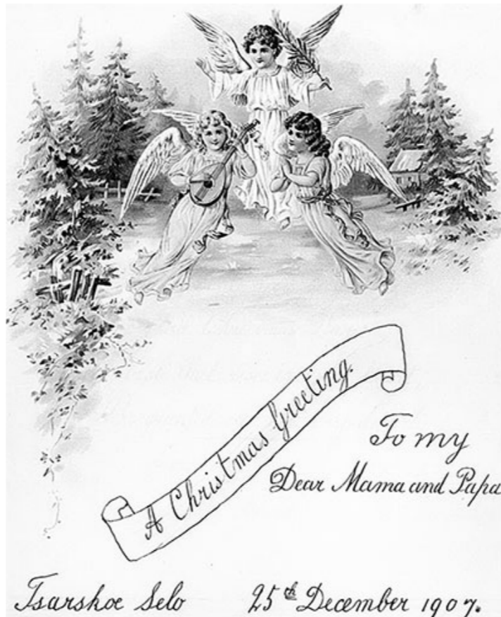
Поздравление великой княжны Марии Николаевны родителей с Рождеством. 25 декабря 1907 год