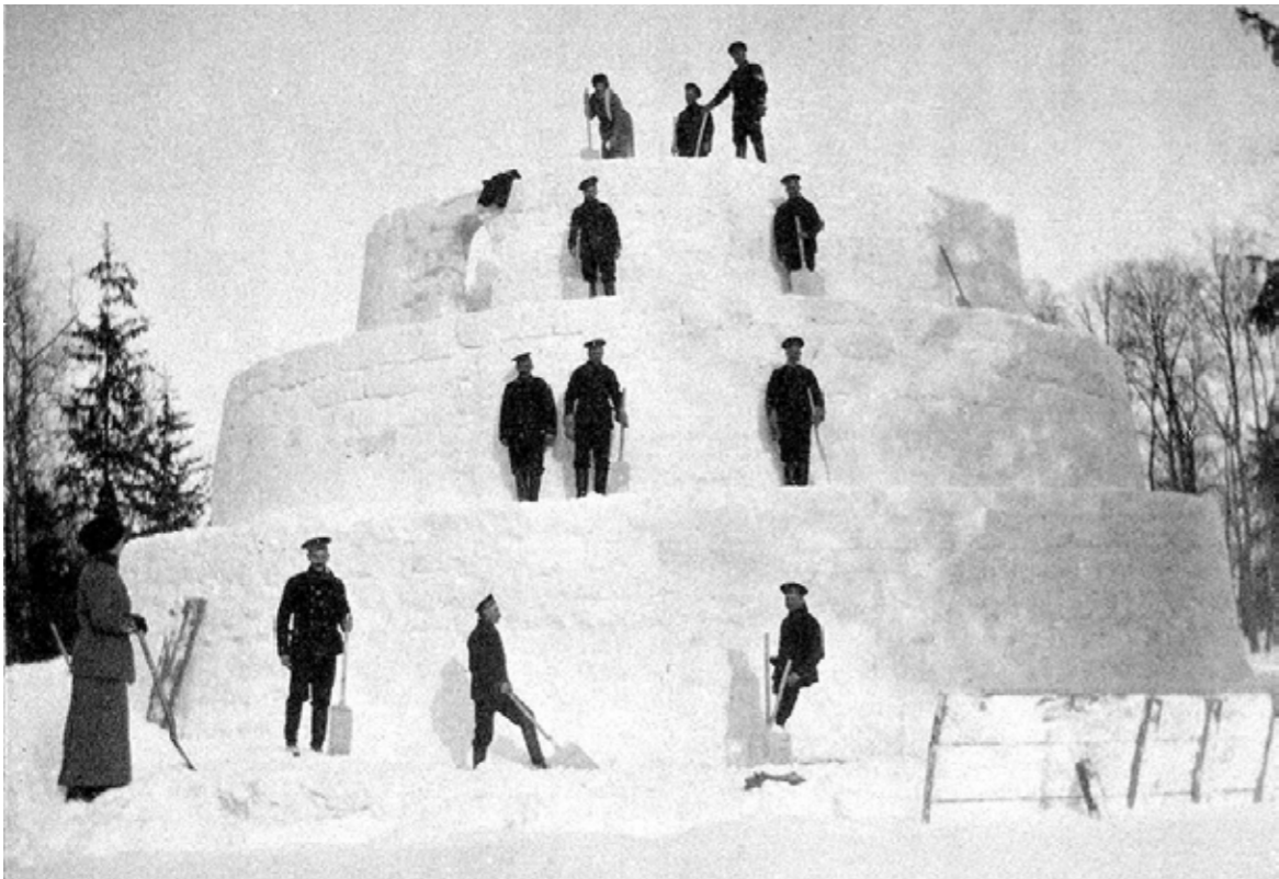
Снежная крепость, построенная в Царском Селе для шуточных боев, 1912 год