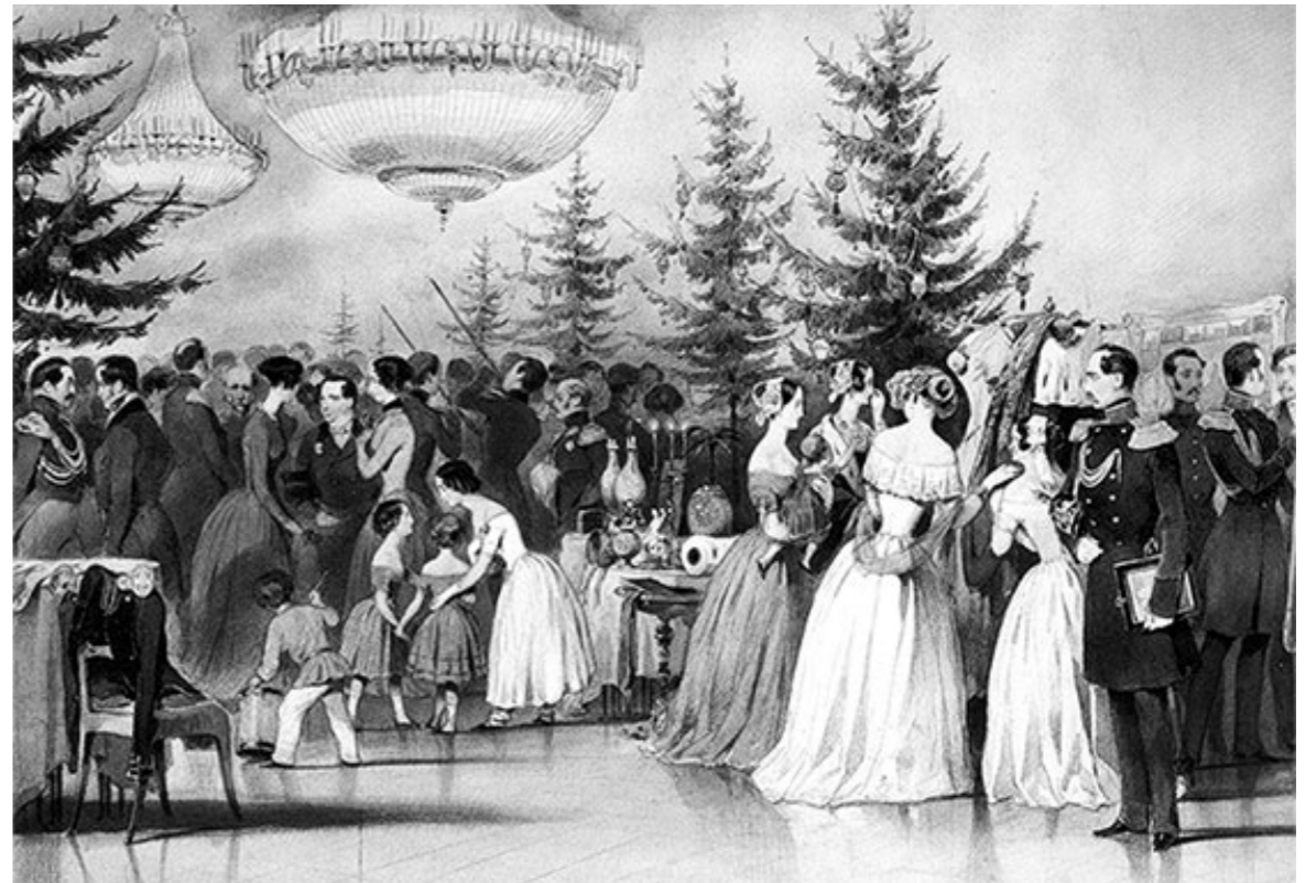
А. Ф. Чернышов. Сцены из семейной жизни императора Николая I. Рождественская елка в Анничковом дворце