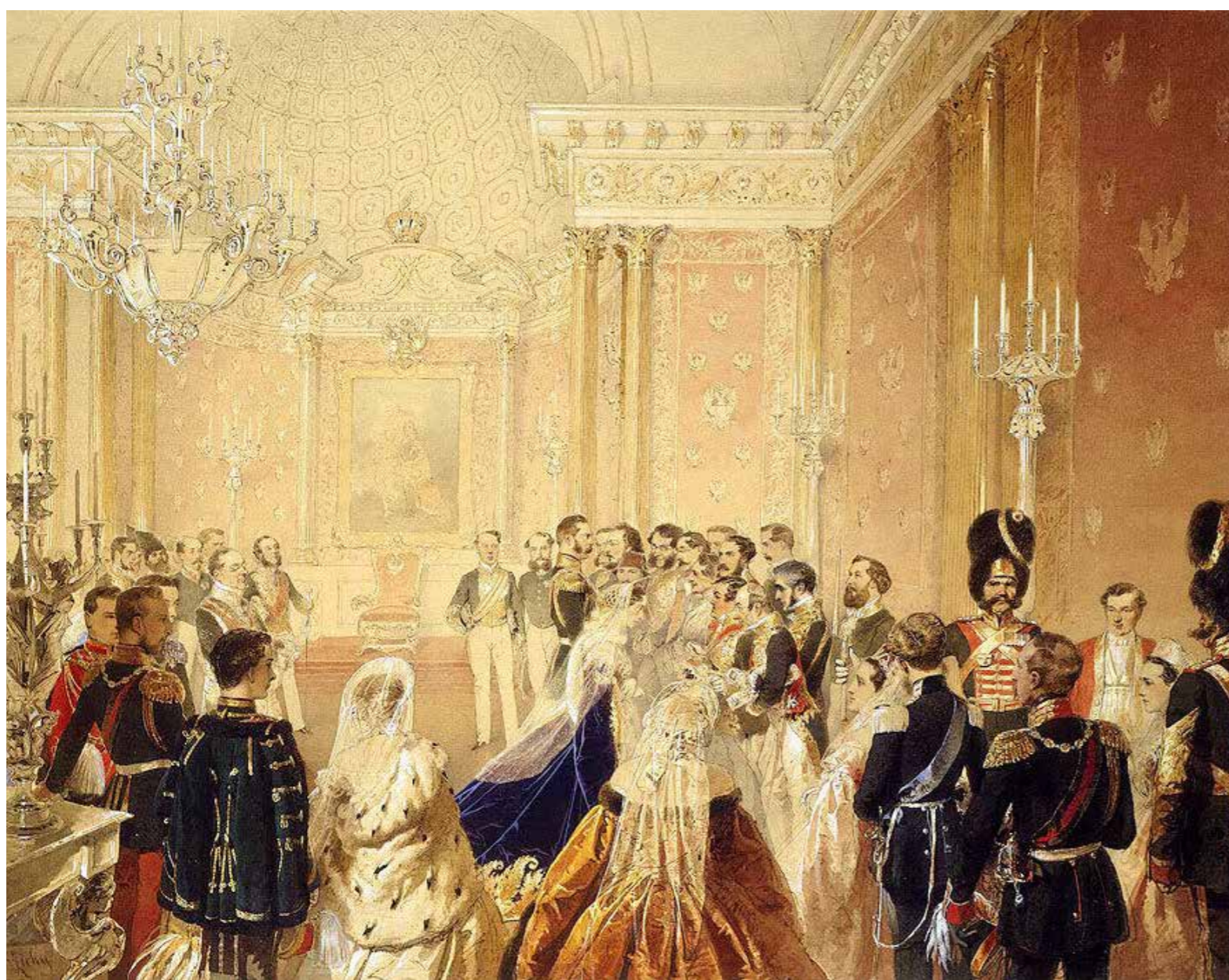
Поздравление Александра II 1 января 1863 года дипломатическим корпусом