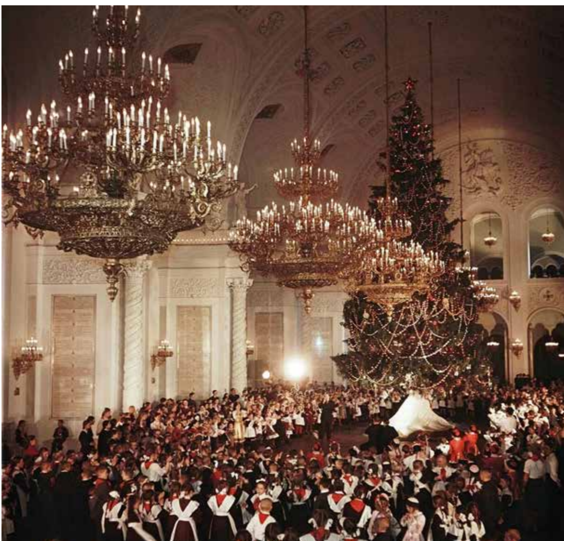
Новогодняя елка в Георгиевском зале Большого Кремлевского дворца

Так, для будущего императора Петра I рождественские ели вырубались в еловом бору у подмосковного Савино-Сторожевского монастыря, расположенного вблизи Звенигорода. При молодом царе Петре I рождественские елки устанавливались как на Боярской площадке, при входе в Теремной дворец, во дворце Милославского (Потешном дворце), так и на Соборной площади Московского Кремля между Успенским собором и Звонницей. По существующим свидетельствам, также ели размещались между Аптекарским приказом и Потешной хороминной на Красной площади, в Тайницком саду у зданий Старых и Новых приказов и у Лобного места перед Спасскими воротами Кремля.