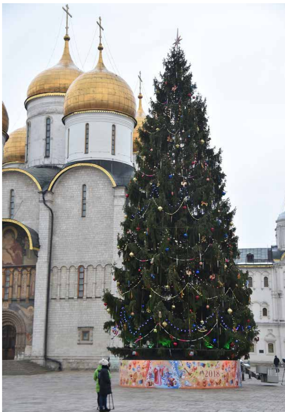
Новогодняя елка на Соборной площади Московского Кремля

Как правило, в прошлые века Рождественские и новогодние елки поставлялись в Московский Кремль из царских имений, а именно из елового бора близ села «Знаменское», находившегося на правом берегу Москва-реки, напротив села «Петрово-Дальнее». Неоднократно елки завозились и из обширного лесного массива, находившегося поблизости от Савино-Сторожевского