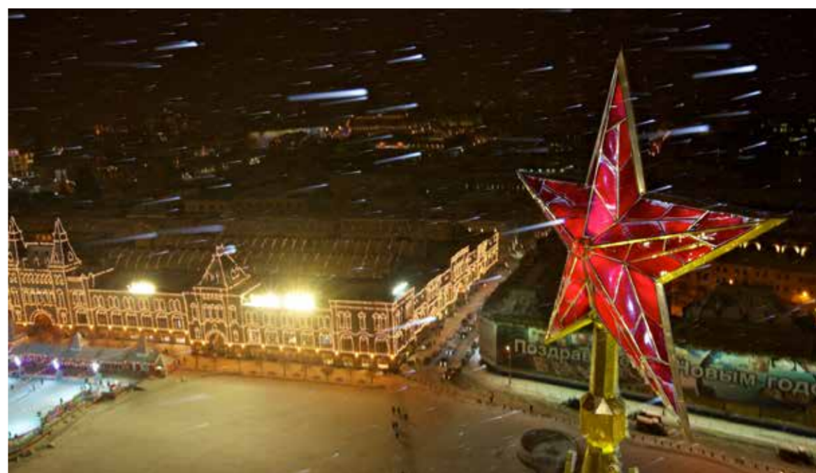
Празднование современного Нового года очень отличается от того, как отмечали его в царской России

Так, 1 января 1862 г. Александр и Владимир встали все в те же семь часов. В восемь утра они пошли на половину старшего брата-наследника пить чай. К половине десятого великие князья собрались в приемной Александра II в полной парадной форме и с Андреевскими цепями. После семейного завтрака братья отправились делать визиты. Один из младших братьев цесаревича