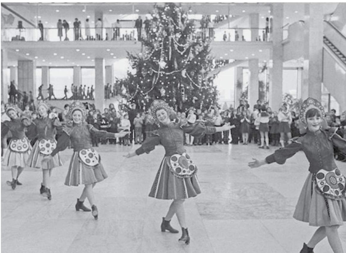
Новогодняя елка в Кремле. 1978 год

Как правило, все кремлевские елки традиционно вырубались и доставлялись на Рождественские и Новогодние праздники с территорий, прилегающих к подмосковным