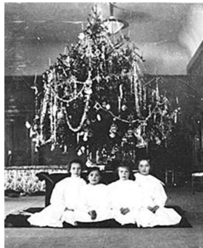
Рождественская елка в Александровском дворце Царского Села. Фото начала XX в.

1 января был обычным рабочим днем, в том числе и для императоров. Перед Новым годом император с семьей присутствовал на обеде, после чего царь и его супруга традиционно совершали обязательные визиты с поздравлениями и вручением новогодних подарков.