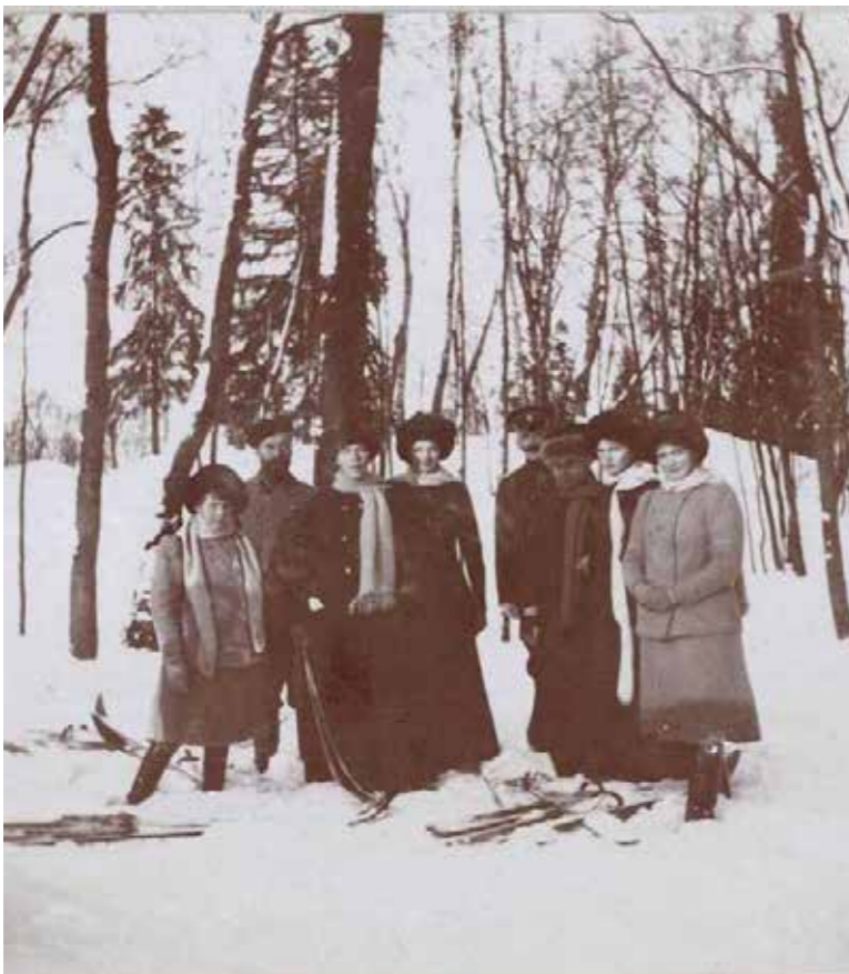
Рождество в Царском Селе

Сергей Девятков, Игорь Зимин